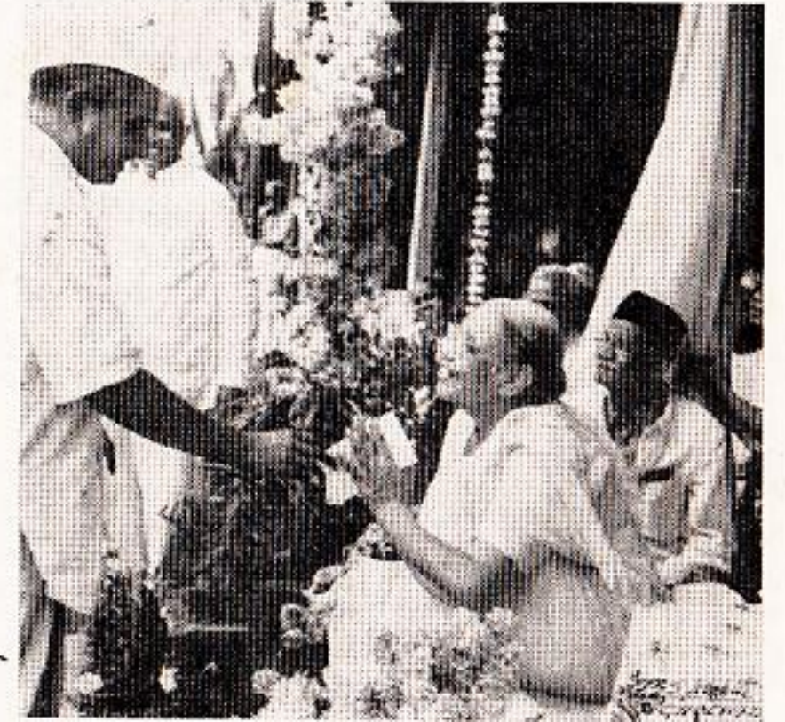
ताराबाईचा वाढदिवस : ' कामापाठीमागे पैसा येतोच ! ' ( देणगी स्वीकारताना ) -